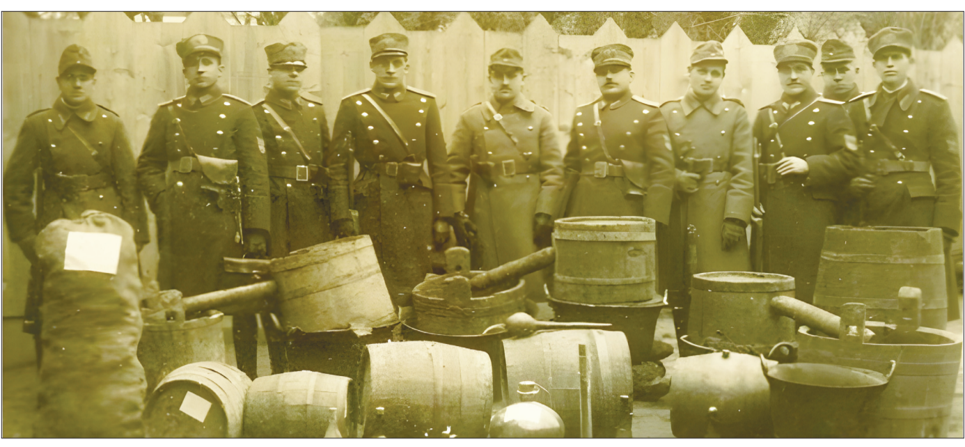
Grupă operativă a Gărzii financiare, la finalizarea unei acțiuni de confiscare a băuturilor alcoolice produse/comercializate ilegal (1945).